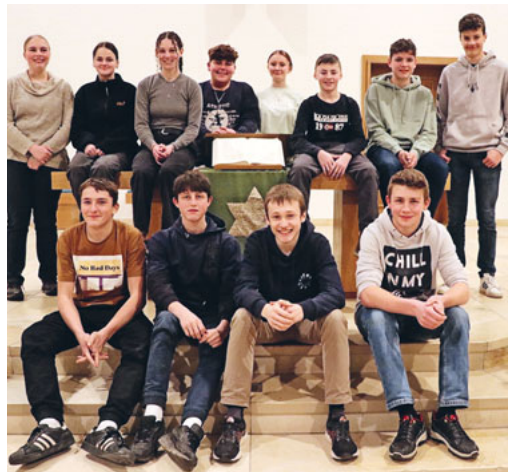
Links die Konfirmandengruppe vom 5. Mai in Lichtensteig und rechts die Konfirmandengruppe vom 12. Mai in Wattwil.