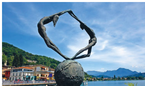
Die Erlebniswoche wird 2024 im schönen Tessin durchgeführt.