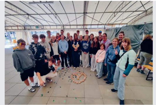
Gruppenfoto Refresh Camp 2025