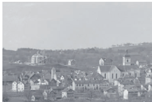
Kirche Haldenbüel im Bau noch ohne Turm, Sicht von der Muelt 1899