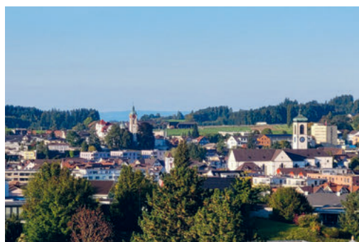
Kirche Haldenbüel, Sicht von der Muelt heute