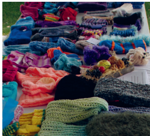
Einige Werke der Strickgruppe

Anfangs wurden von 14 Frauen Plätzli gestrickt, aus denen wärmende Decken entstanden. Heute besteht die Gruppe aus ca. 30 Strickerinnen. 14 Jahre lang sandten wir Pakete nach