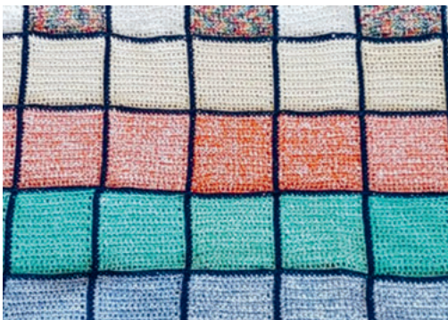
Strickdecke aus Plätzli zusammengestellt.

Am 20. Oktober 2005 wurde diese Gruppe von Barbara Huber und Louise Meier gegründet. Ihre Idee war, aus Wollresten Decken zu stricken für Waisenhäuser des Bartimäus-Projekts in Indien – ein Projekt der Inter-Mission.