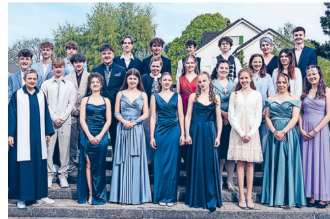
Bild: Konfirmanden 2026