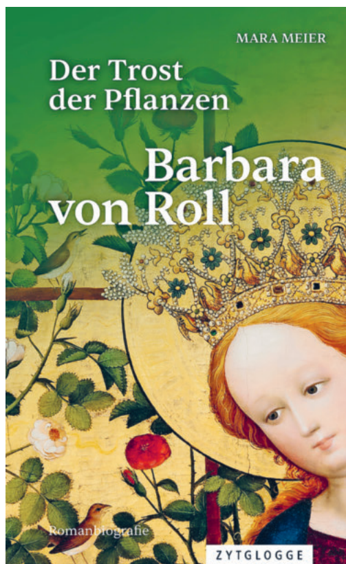
Cover Der Trost der Pflanzen / Zytglogge