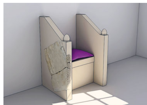
St.Gallen, St.Mangen. Rekonstruktion des Steinthrons von Abtbischof Salomo, um 900

Die Führungen finden um 13, 14, 15 und 16 Uhr statt. Daneben ist eine separate Turmbesteigung möglich. ■