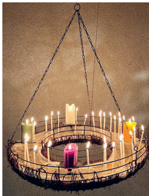
Adventskranz hängend (Kirche Degersheim 2024)

So gehen wir durch diese Wochen mit offenen Händen. Ohne alles festhalten zu müssen. Ohne alles allein tragen zu müssen.