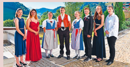
Konfirmanden vom 25. Juni 2023

Wir wünschen den Konfirmanden auf ihrem weiteren Lebensweg alles Gute und Gottes Segen.