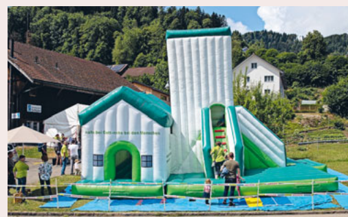
Die Gumpikirche auf der Wiese neben dem Festzelt.

An dieser Stelle danken wir nochmals allen Helfer:innen für ihre tatkräftige Unterstützung für das gelungene Jubiläumsfest.