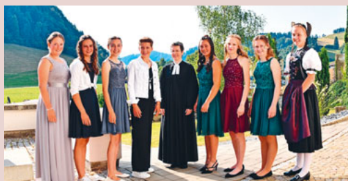
Konfirmanden vom 18. Juni 2023

Nach den Feiern wurde an den gemeinsamen Apéro ausgelassene Gespräche geführt, welche durch die Musikgesellschaft Brunnadern musikalisch untermalt wurden.