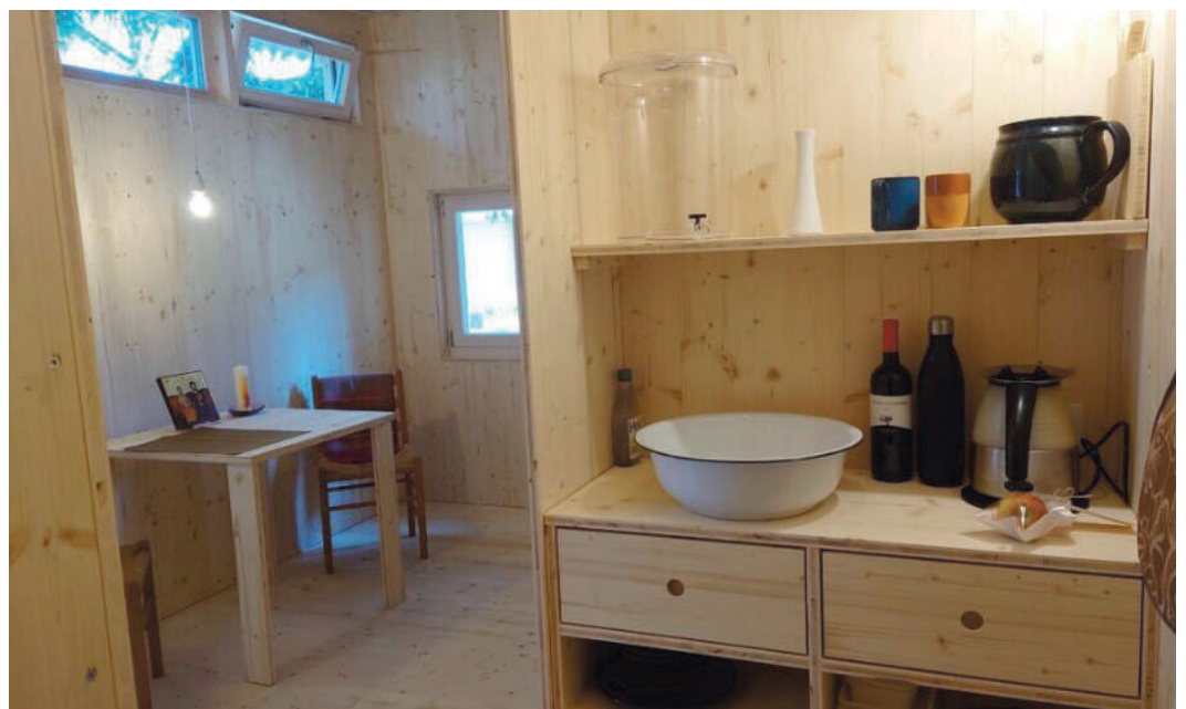
Das Innere der Wiborada-Zelle.

In diesem Jahr wird in der Zelle bei der Kirche St.Mangen jeden Tag eine andere Person anwesend sein, um für die Menschen in der Stadt da zu sein. Ob Buschauffeur oder Stadtpräsidentin, Nobody oder Bratwurstpromi. Alle Teilnehmenden haben ein offenes Ohr und viel zu berichten. Der Aufenthalt dauert jeweils von