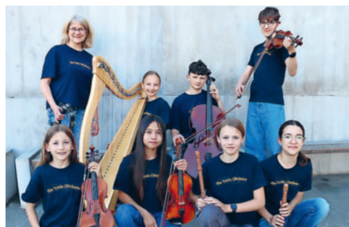
The Little Chieftains, Musikschule Oberuzwil/Jonschwil

Samstag, 13. Juni, 19 Uhr, im Kirchnerpark mit The Little Chieftains - Musikschule Oberuzwil/ Jonschwil. Anschliessend gemütliches Beisam- mensein mit Grillwürsten und Getränken. Bei schlechtem Wetter findet das Konzert in der Kirche Nesslau statt.